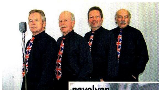
revolver the beat of the 60s